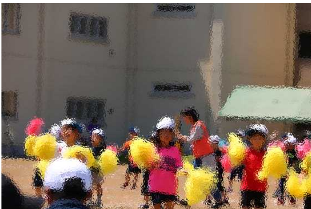
1・2年生 ヤングマン