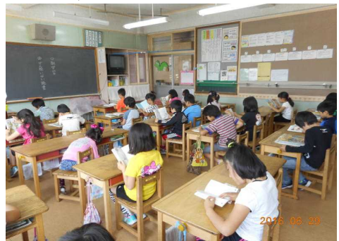
2年生 朝読書の様子

1学期も終盤を迎え、学校の授業も大詰めです。落ち着いた学校生活を送り、学力をしっかりつける取組として、6月からは朝読書に担任がつくようになっています。子供達だけ朝読書では徹底できなかったところも、担任がつく事により、ゆっくり静かに読むことができています。ご家庭でもまずは、 「早寝 早起き 朝ご飯」 を徹底して、家庭でじっくり学習する環境を整えてあげることに、全力を注いでいただきたいと思います。小学生のこの時期に学ぶ楽しさを味わえば、将来にわたって学ぶことを苦痛に思わないはずで