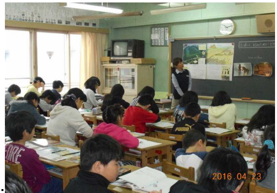
全校参観日 6年生社会