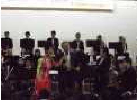
指揮をする校長先生

12月13日(火)東京フィルハーモニー交響楽団本公演が行われました。北海道が大雪に見舞われた後でしたが、順調に到着し、すばらしい演奏を堪能する事が出来ました。鑑賞のみならず、参加型の公演で、指揮者体験コーナーや、児童のボディパーカッション児童会で考案した歌詞でのフィンランディアの大合唱そして、圧巻は80名のフルオーケストラ伴奏での校歌でした。いつも歌っている校歌に壮