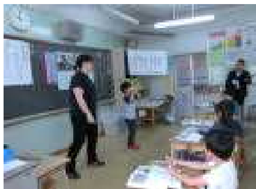
1年1組での研究授業