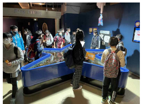
マリパークニクス見学