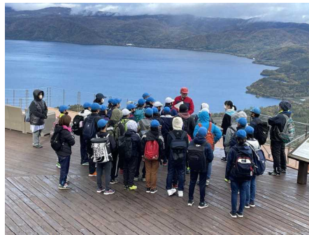
有珠山山頂駅にてガイドから説明