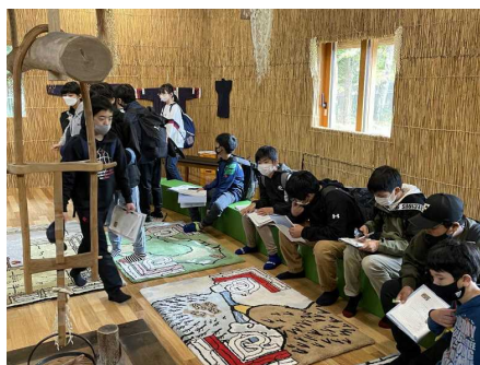
ウポポイ内チセ（家屋）見学