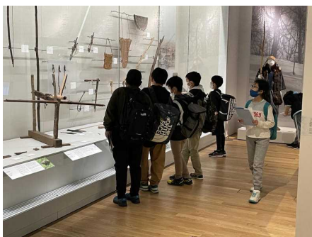
ウポポイ内博物館見学